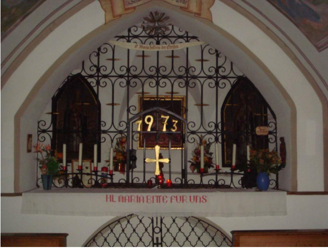
Die Waldkapelle in Stuhlfelden.