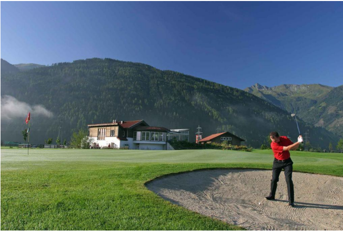
Golfen vor den höchsten Bergen Österreichs!